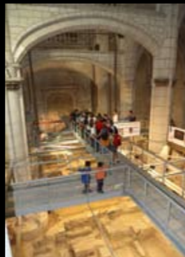
Catedral de Santa María