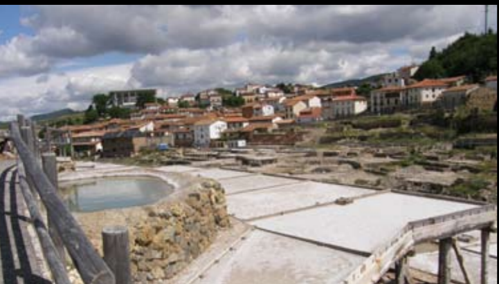
Salinas de Álava

Su gastronomía. Aquí podrás degustar desde los platos más tradicionales de la gastronomía hasta las más avanzadas creaciones de la nueva cocina vasca, todo ello regado por los estupendos caldos de Rioja Alavesa y el Txakolí de Álava. Y para terminar algo dulce, que la pastelería vitoriana siempre ha gozado de bien merecida fama.