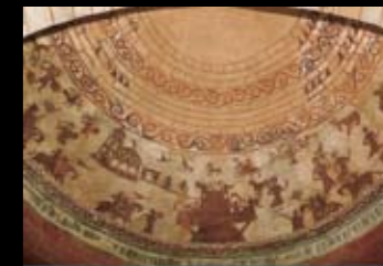
Pinturas medievales de Álava

El casco histórico de la capital, declarado conjunto monumental en 1987 es uno de los más bellos y mejor conservados de todo el norte de la península. Álava cuenta, a su vez, con una serie de villas amuralladas y torres medievales magníficamente conservadas.