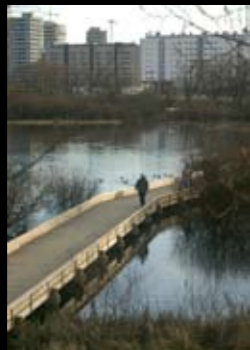
Vitoria-Gasteiz Anillo Verde

Su naturaleza. Vitoria-Gasteiz es la ciudad que cuenta con el índice más elevado de zonas verdes por habitante, sólo un dato, en la ciudad hay plantados más de 130.000 árboles de 150 especies distintas. Un anillo verde, formado por 4 grandes parques, abraza la ciudad. En los cuatro puntos cardinales de Álava existen parques naturales con rutas señalizadas para la práctica del senderismo.