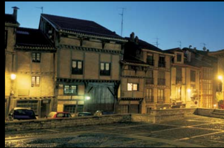
Plaza de la Burullería